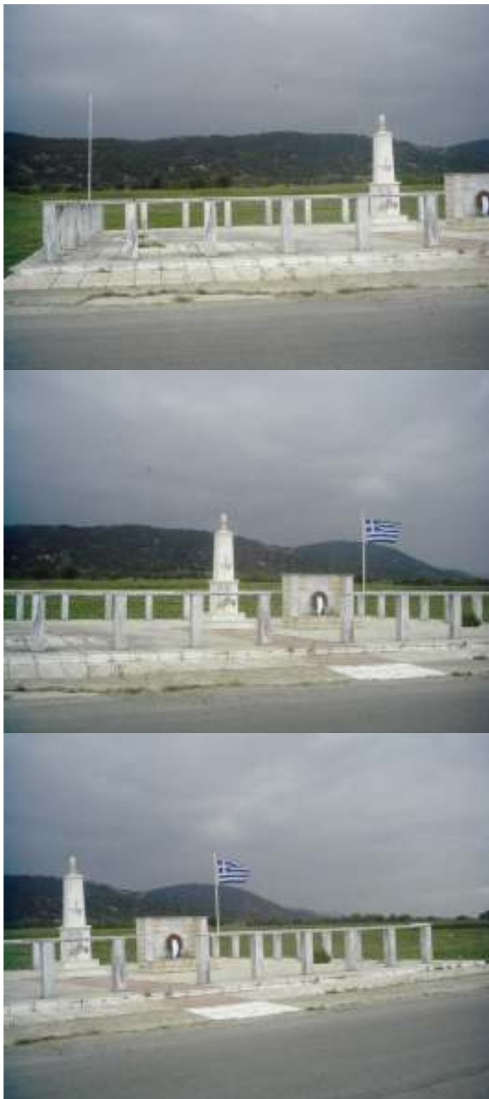
Σχέδιο πρότασης διαμόρφωσης